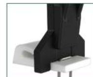
Versione 104 (Fissaggio clip) 104 version (Clip Fixing)