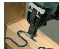
Versione NO-SAG NO-SAG model