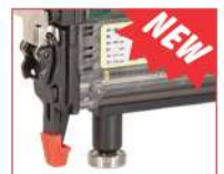
Versione D - D model