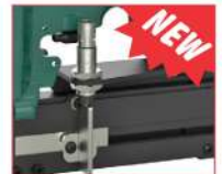
Sensore a richiesta Sensor on request