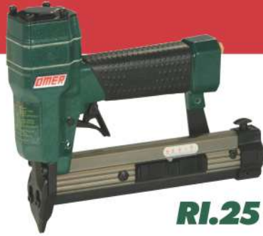
RI.25 - RI.28