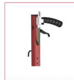
Versione CP - CP model