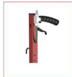
Versione CP - CP model