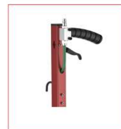
Versione CP - CP model